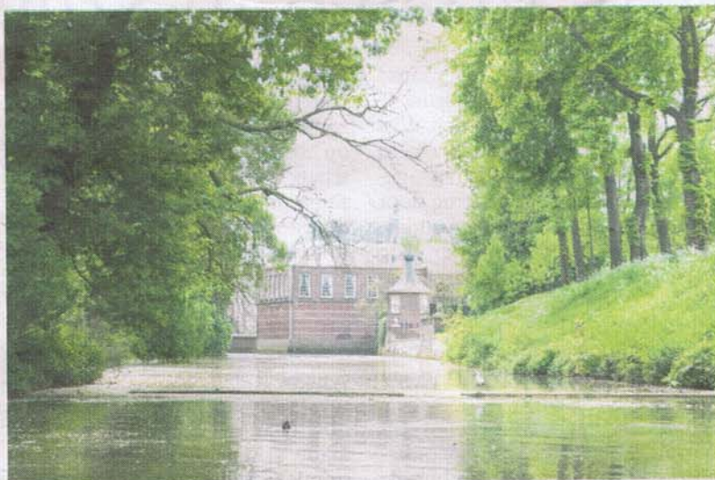
Een verstilld Kasteel van Breda.

ruime sop. En dan merk je meteen al hoe anders een stad eruit ziet vanaf het water. Auto's verdwijnen uit het zicht achter de uitbundig groene oevers, moedereenden met kroost snateren je toe en de gebouwen langs de kant krijgen opeens een heel ander karakter. Zo zien de CSM-silo's er vanuit onze boot nog imposanter uit en zie je de prachtigste gevels waarvan je je afvraagt waarom die je nooit eerder zijn opgevallen. En tenslotte: wat zijn er toch ontzettend veel bruggen in de stad! We ploegen moedig tegen het